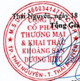
Đặng Thiệu Hoa