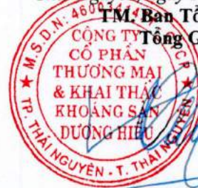
Dương Hữu Hiếu